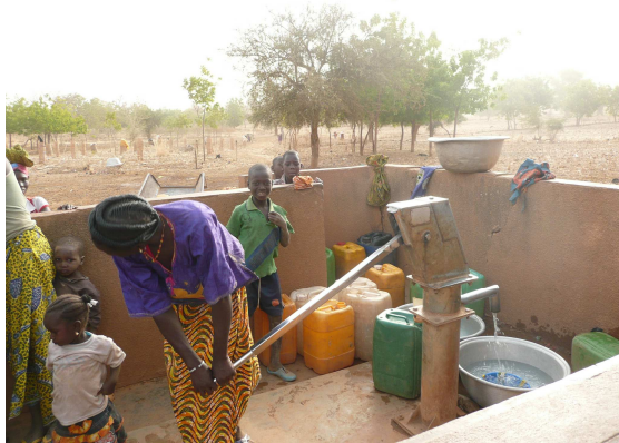
Traditioneller Brunnen in einem Dorf bei Kongoussi