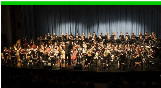
Benefizkonzert mit dem Goethe-Gymnasium und dem Johanneum zu Lübeck

„Orchesterglanz und Bigband-Spirit“ – unter diesem Motto hatte der Förderkreis zu seinem Benefizkonzert im Mai eingeladen.