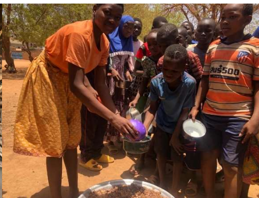
Die erste Essensausgabe