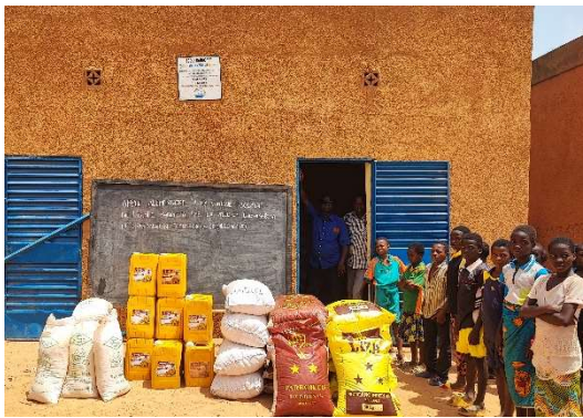
Das neue Magazin, das auch von Ludwigsburg finanziert wurde