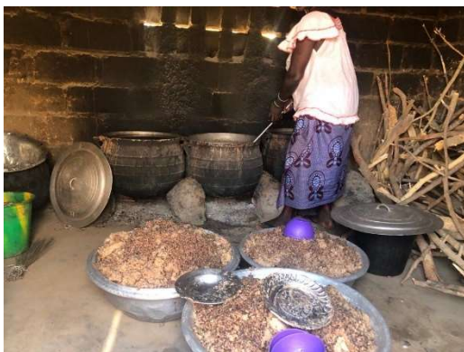
Schulküche in Bango