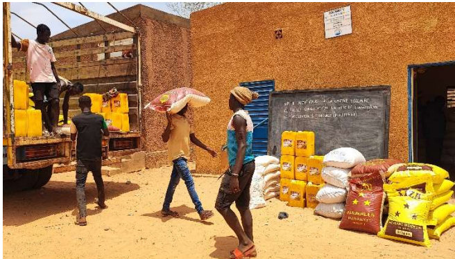
Der LKW wird entladen