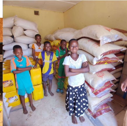
Freude bei den Schüler/innen über das volle Vorratsmagazin